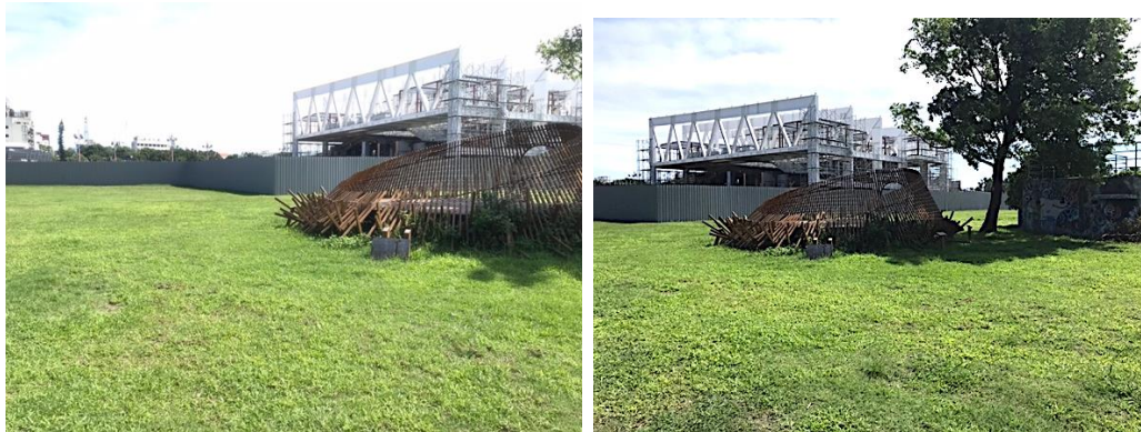
陽光電城外圍草地地點