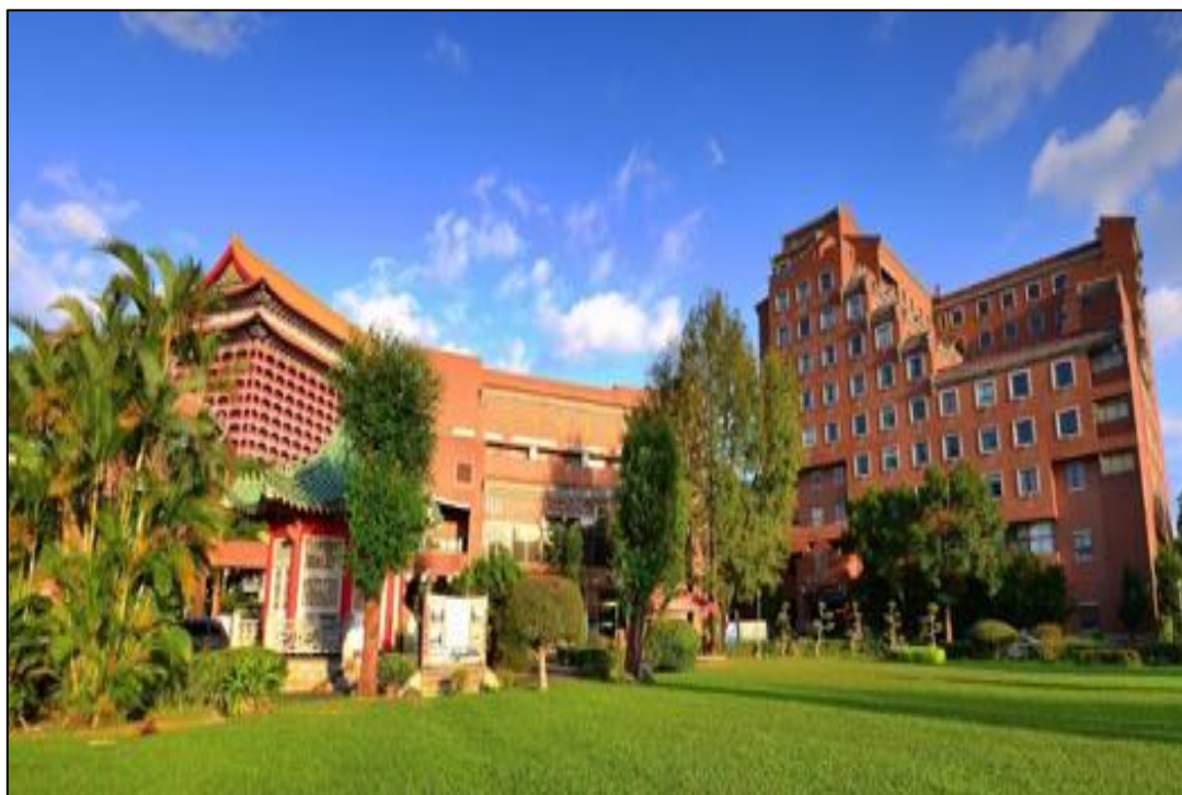
▲此為活動中心場館外觀圖，擁有相當不錯的環境舉辦成果展。