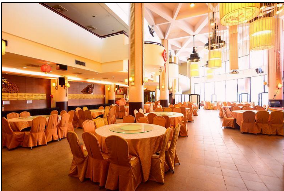
▲第一天晚宴位於宴會廳一樓，並附有投影機與麥克風，離主會場步行約一分鐘。