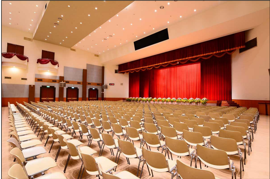
▲群英堂場地足夠容納 220 人，也有足夠空間可以擺設展示區。