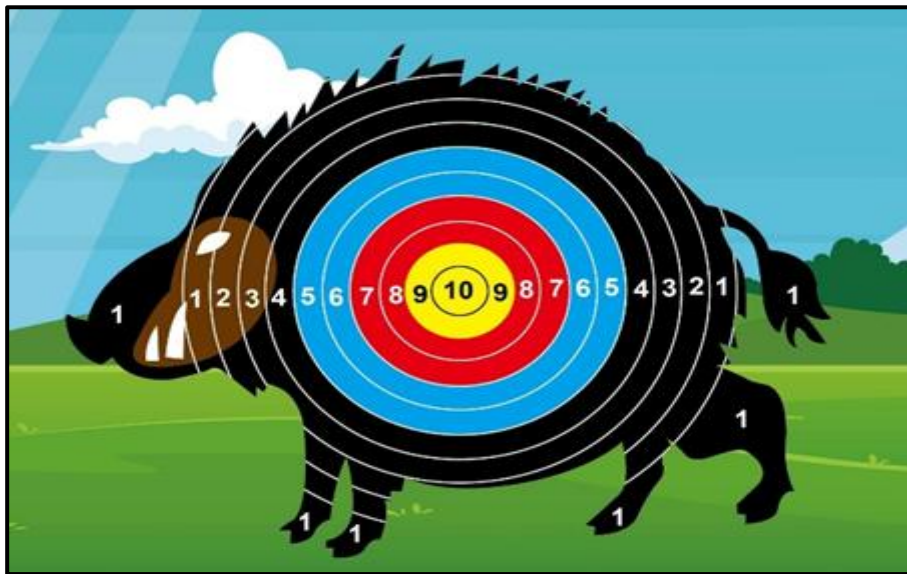
活動流程表(暫定)日期:115年06月19日(星期五)